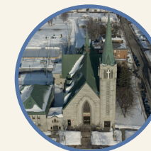
Saint-Rodrigue 4760, 1 re Avenue