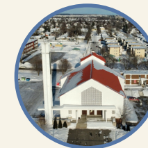
Saint-Jérôme 6350, 3 e Avenue Est