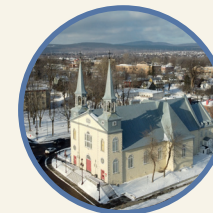
Saint-Charles-Borromée 7990, 1 re Avenue

La paroisse Saint-Charles-Borromée compte 4 églises.