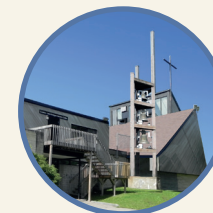
Sainte-Cécile 9150, avenue Jean-Paquin