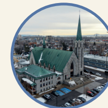
Saint-Rodrigue 4760, 1 re Avenue