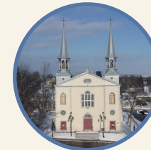
Saint-Charles-Borromée 7990, 1 re Avenue

La paroisse Saint-Charles-Borromée compte 4 églises.