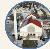
Saint-Jérôme 6350, 3 e Avenue Est