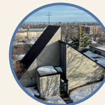
Sainte-Cécile 9150, avenue Jean-Paquin